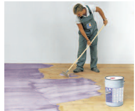
PCI Gisogrund 404 in der Kontrollfarbe violett ermöglicht eine hohe Verbundhaftfestigkeit von Ausgleichsmassen und Verlegewerkstoffen zum jeweiligen Untergrund.