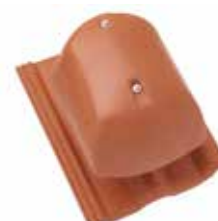
Lüfter DN 160 inkl. Anschlussrohr, Schablone und Anschlussring Plus