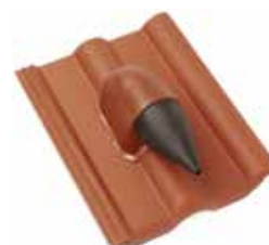
Solar-/Kabeldurchgang (ø bis 70 mm)