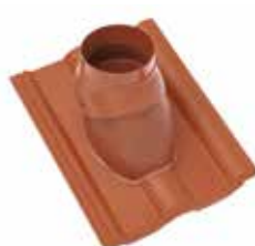
Abgasrohrdurchgang (ø 116 mm oder 128 mm)