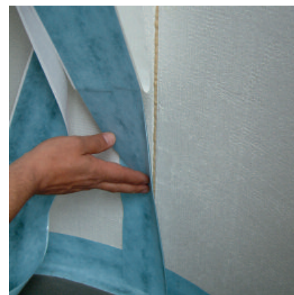
Schutzfolie abziehen und PCI Pecitape WS ohne Vorspannung mit kräftigem Druck aufkleben – fertig!