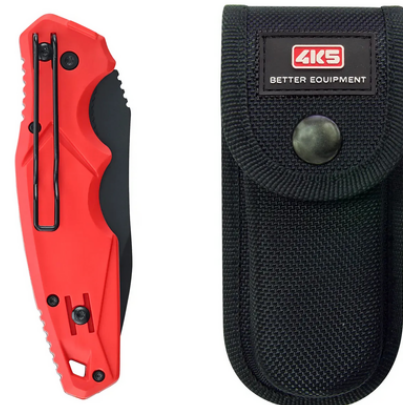
TK 100, Holster