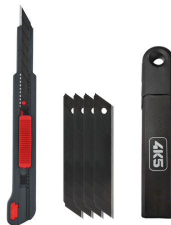
CR 9 S, 5 Klingen