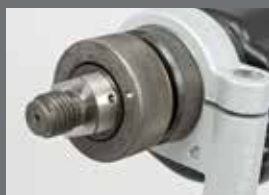
Verstellung für zuschaltbaren Softschlag