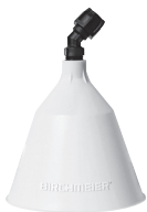
Sprühschirm ø 12.5 cm, steckbar Art.Nr. 11864801