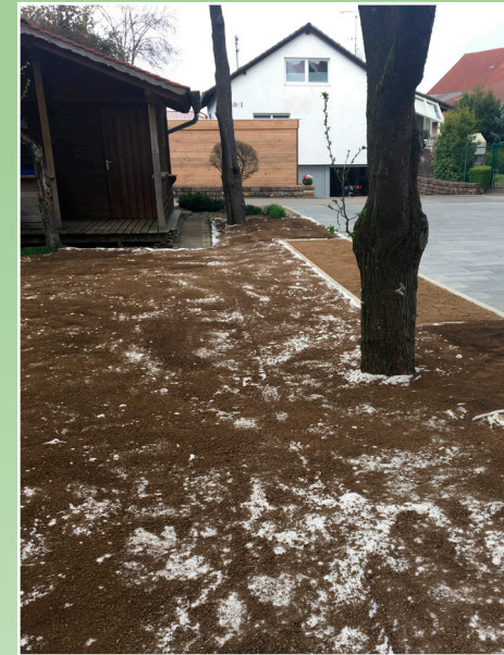
Verlegung & Abdeckung

Wir wünschen Ihnen viel Freude mit Ihrem wollrasen® .