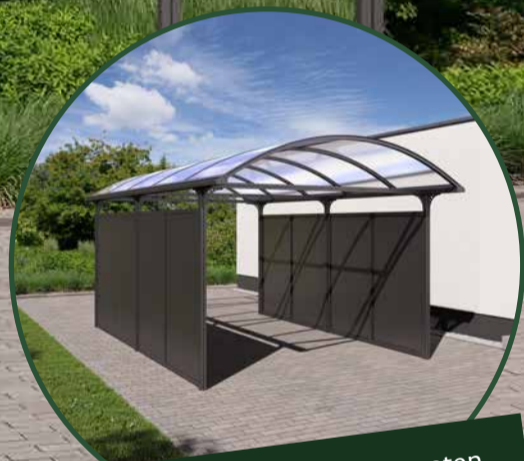
Optional mit Seitenelementen