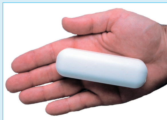
Abbildung 1: Selen-Pille: 1 mmol (79 mg) Selen aus Natriumselenit.