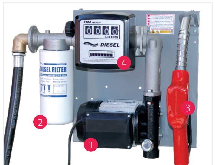
Modell FLW (Wandpumpe)