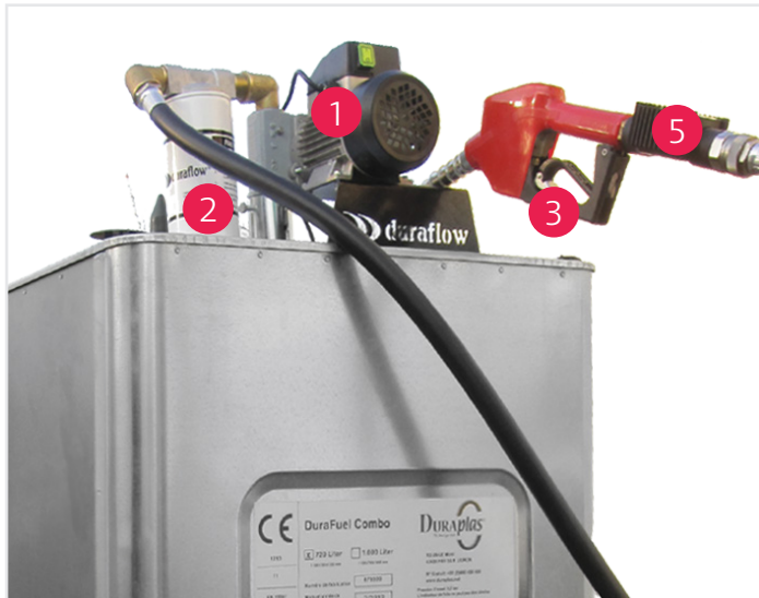
Modell A (Pumpe auf dem Tank)