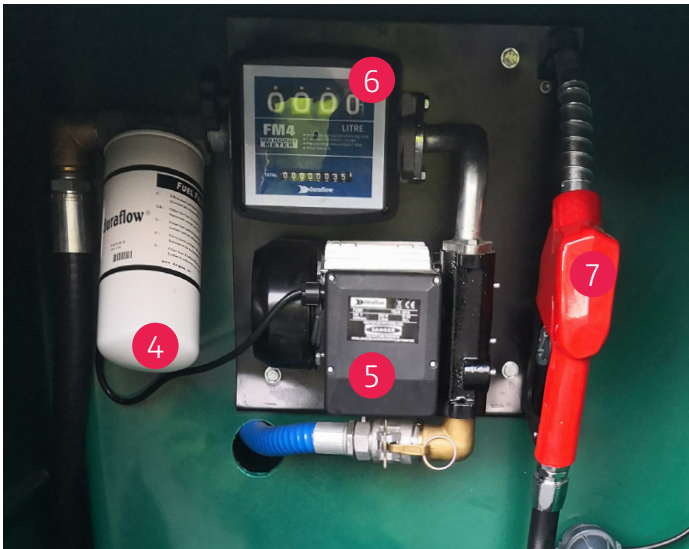
Wandpumpe in abschließbarem Vorbauschränk