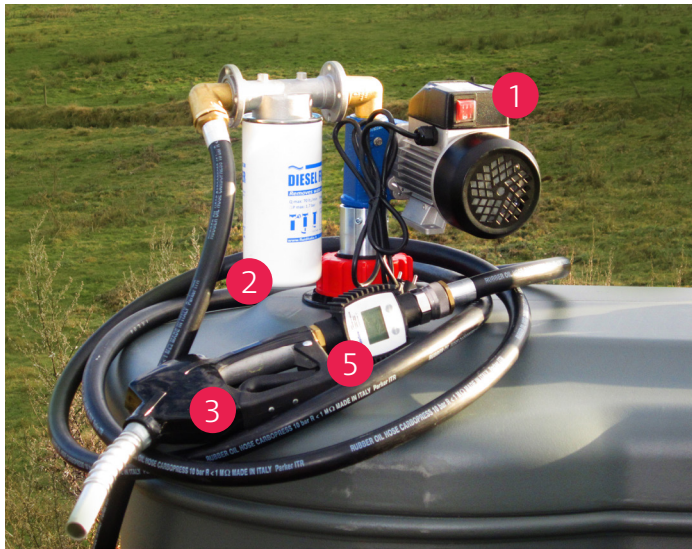
Modell A (Pumpe auf dem Tank)