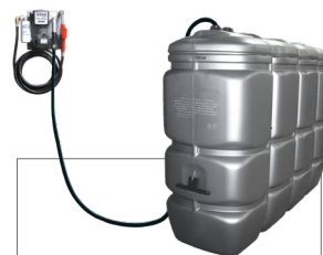
2.000 l Artikel-Nr. DFS2000FLW