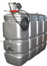
2.000 l Artikel-Nr. DFS2000A