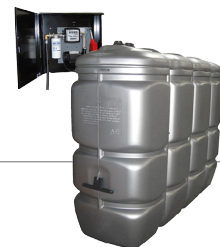
2.000 l Artikel-Nr. DFS2000FLT