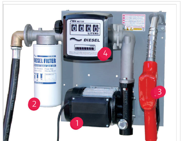
Modell FLW (Wandpumpe)