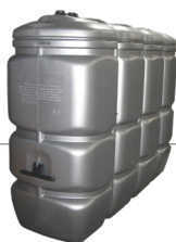
2.000 l Artikel-Nr. DFS2000T