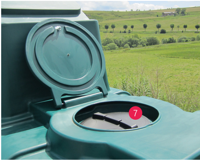
Großes Mannloch (Durchmesser: 430 mm)