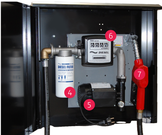
Wandpumpe in abschließbarem Metallschrank