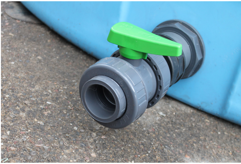
Vormontierter Tankflansch inklusive zwei Zoll Kugelhahn D50 (Kunststoff) (Abbildungen können vom Original abweichen)