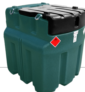
950 l Artikel-Nr. DFT950NP60