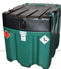
600 l Artikel-Nr. DFT600NP60