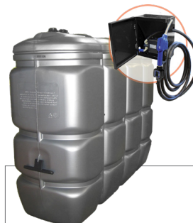
2.000 l Artikel-Nr. DFAD2000FLW