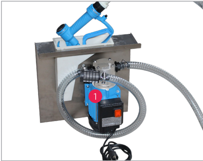
Manuelle Zapfpistole ohne Zählwerk