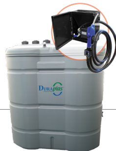
1.450 l Artikel-Nr. DFAD1500FLW