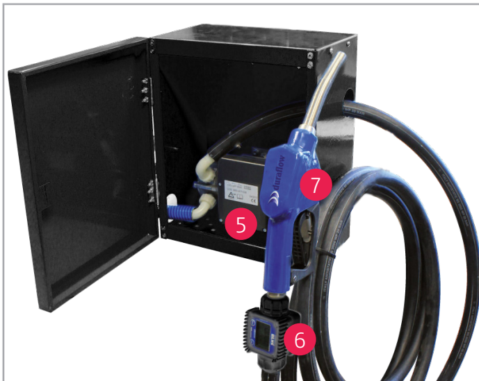
Wandpumpe in abschließbarem Metallschrank