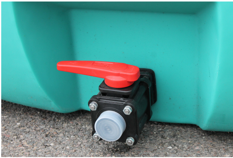
Vormontierter Tankflansch (Kunststoff) inklusive zwei Zoll Kugelhahn DN50 (Abbildungen können vom Original abweichen)