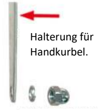
Halterung für Handkurbel.

Stecken Sie die Handkurbel auf die Halterung und drehen dann die Scheibe / Mutter auf das Gewinde. Befestigen Sie die Schraube mit einem Sechskantschlüssel und einem Maulschlüssel.