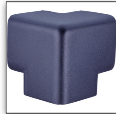
TYP H 3D