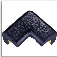
TYP E 2D