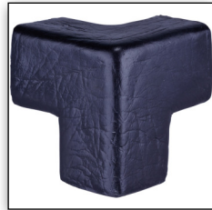
TYP E 3D