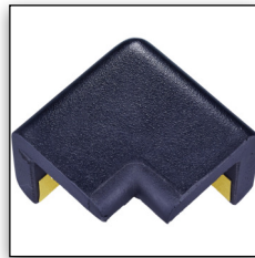
TYP H 2D