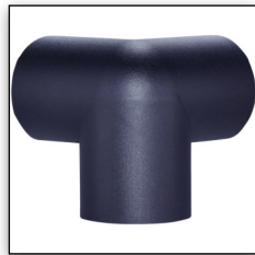
TYP A 3D