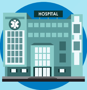
Cuidado de la Salud