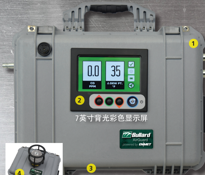
7英寸背光彩色显示屏