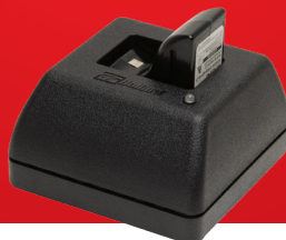
Base cargadora de baterías Eclipse