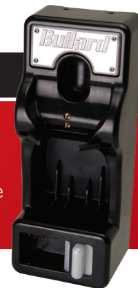
Cargador Eclipse Powerhouse