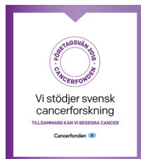
Delningsbild i sociala medier 1000 x 1150