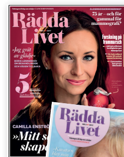
Tidningen Rädsla Livet