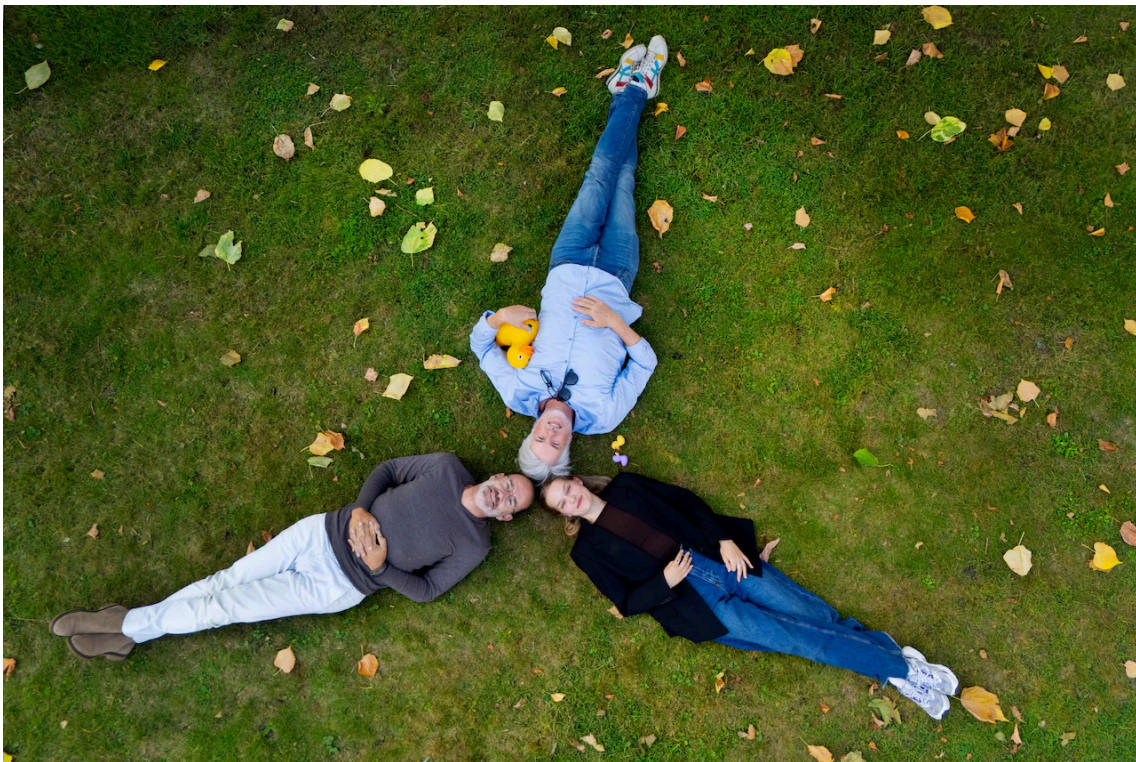
De initiatiefnemers van Digitaal Dorpsplein en HetNetwerk/Niet in je Eendje onderschrijven dezelfde waarden: 'We willen mensen met elkaar verbinden.'