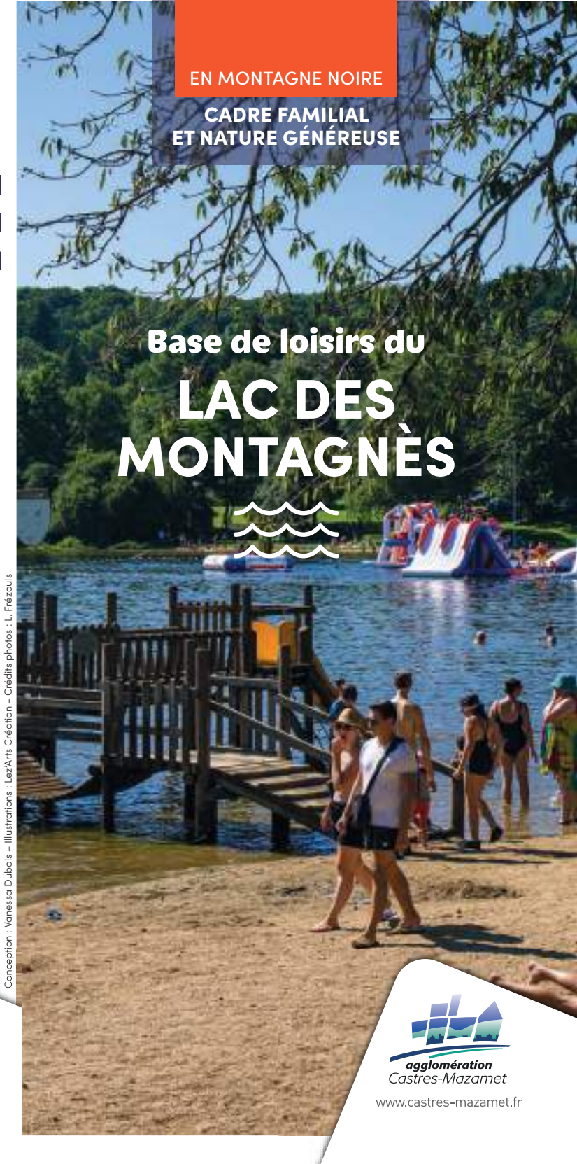
Conception : Vanessa Dubois - Illustrations : Lez'Arts Création