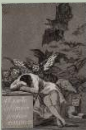
Francisco de Goya y Lucientes Série Les Caprices, 1797-1799 Le Sommeil de la raison produit des monstres Gravure - Collection musée Goya