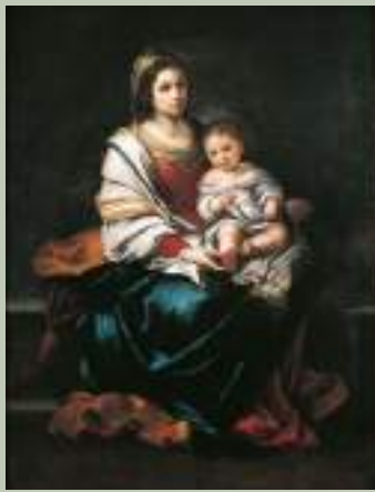
Bartolomé Estebán Murillo (Séville, 1617 - id., 1682) La Vierge au chapelet, vers 1650 Huile sur toile - Dépôt musée du Louvre