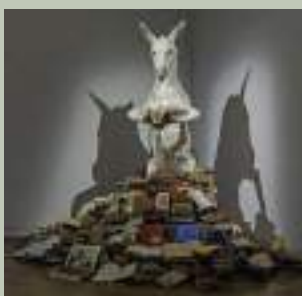
Pilar Albarracín (Séville, 1968) Asnería, 2010 Installation en trois dimensions, âne naturalisé, livres Dépôt musée des Abattoirs - Frac Occitanie Toulouse - © Adagp, Paris, 2024