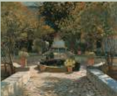
Santiago Rusiñol y Prats (Barcelone, 1861 - Aranjuez, 1931) La Cour des orangiers, 1904, huile sur toile Dépôt musée d'Orsay