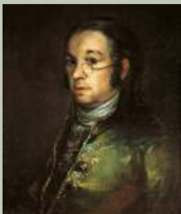
Francisco de Goya y Lucientes Autoportrait aux lunettes, vers 1800 Huile sur toile - Collection musée Goya