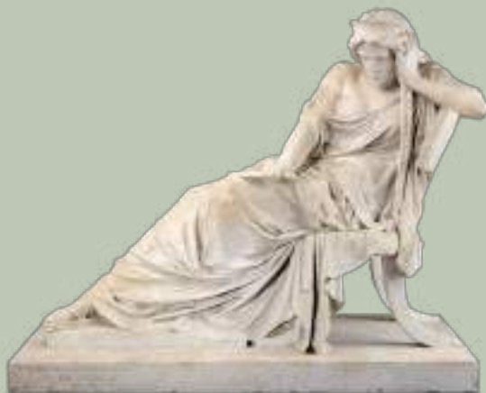
Venecio Vallmitjana y Barbany (Barcelone, 1830 - Id. 1919) Médée, 1875, marbre - Collection musée Goya