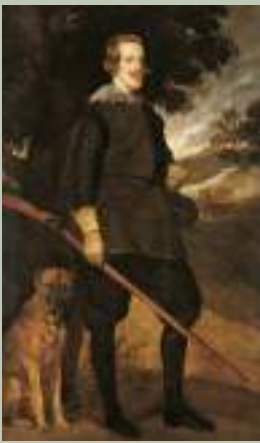
Diego Velázquez (Séville, 1599 - Madrid, 1660) Portrait de Philippe IV en chasseur, vers 1634-1636 Huile sur toile - Dépôt musée du Louvre