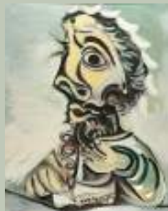
Pablo Picasso (Malaga, 1881 - Mougins, 1973) Buste d'homme écrivant, 1971 Huile sur toile Dépôt musée Picasso, © Succession Picasso 2024