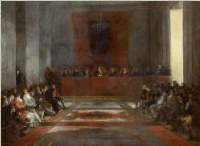
Francisco de Goya y Lucientes (Fuendetodos, 1746 - Bordeaux, 1828) L'Assemblée de la Compagnie Royale des Philippines, 1815 - Huile sur toile - Collection musée Goya - © Cliché F. Pons