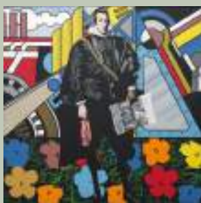
Equipo Crónica La Factoría y Yo, 1971 Sérigraphie en couleurs sur toile - Dépôt musée des Abattoirs, Frac Occitanie Toulouse - © Adagp, Paris, 2024