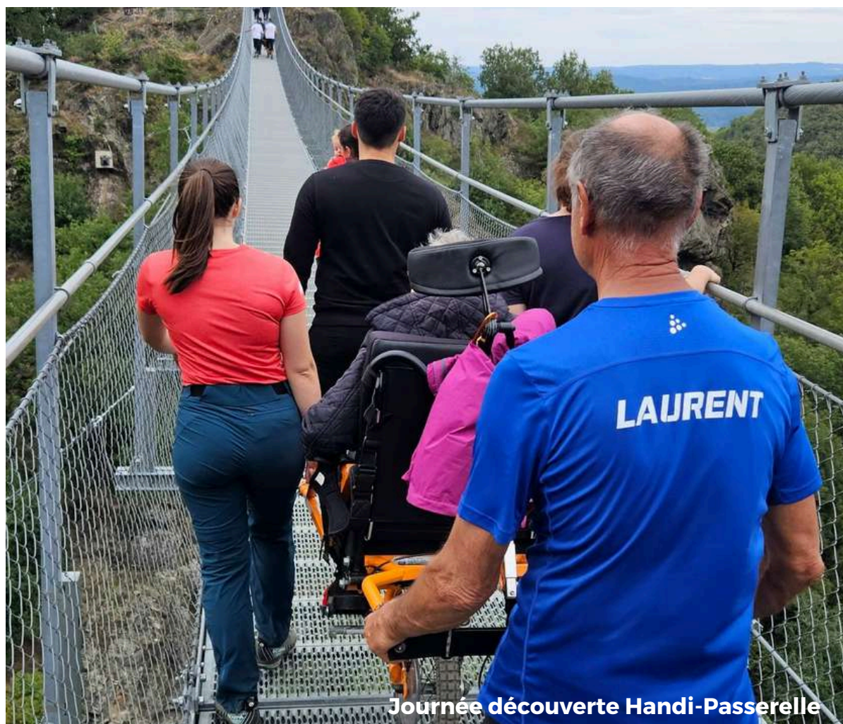
Journée découverte Handi-Passerelle