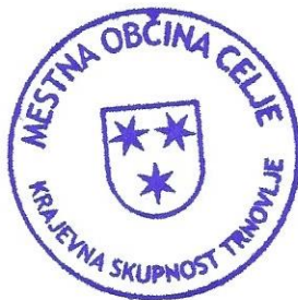
Alenka Golež, predsednica Sveta KS Trnovlje

Št. zadeve: 031-19/2019 Celje, 21. 5. 2019