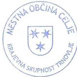
Alenka Golež, predsednica Sveta KS Trnovlje

Št. zadeve: 031-19/2019 Celje, 19. 2. 2019