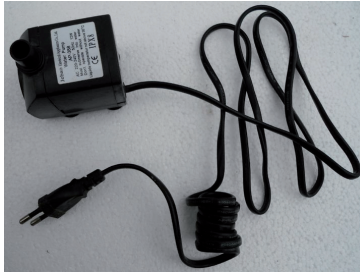
B) Bomba eléctrica