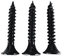
C) 3 tornillos