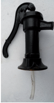
A) Pompe manuelle