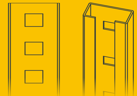
Fig. vue de face (perforations au pas de 31,25 mm)