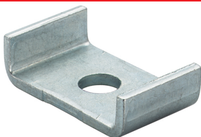
Griffe de maintien HK 41