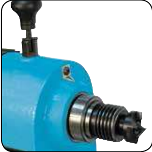
Diviseur 12 Positions Verdeler met 12 posities