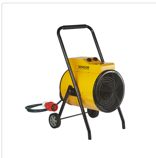
Sovelor C 31