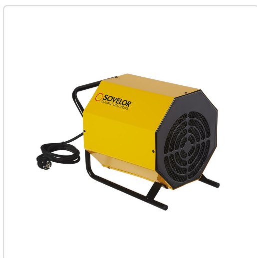
Sovelor C 3

Ne dégageant ni odeur ni gaz de combustion, ils délivrent une chaleur saine et peuvent être utilisés dans les locaux fermés, les zones confinées ou en sous-sol, ainsi que dans les locaux où la présence d'une flamme est indésirable.