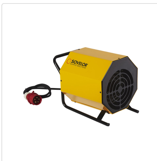
Sovelor C 5