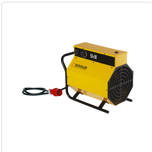
Sovelor C 9