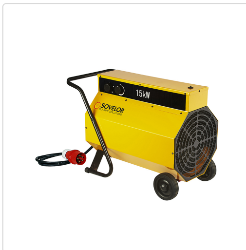
Sovelor C 15