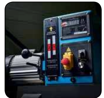
Variateur électronique Elektrische toerenregelaar