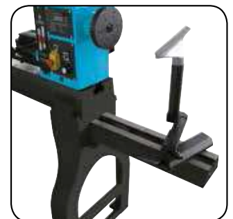
Rallonge et support d'outil extérieur Verlenging en gereedschapshouder langs de buitenkant