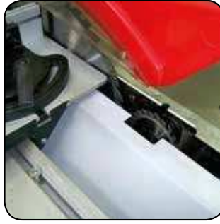
Lame Ø 315 inclinable à 45° et inciseur de 100mm Blad met Ø 315 verstelbaar tot 45° en voorritser 100mm