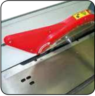
Chariot ras de lame de 2000mm Rolwagen van 2000mm