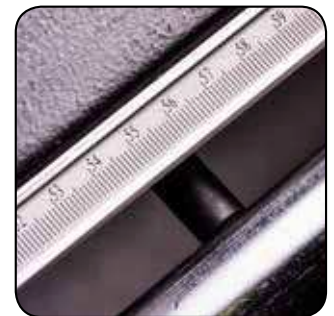
Guide de refente avec réglage micro-métrique Parallele geleider met micrometrische regeling