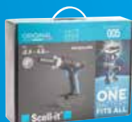
(2) Coffret carton