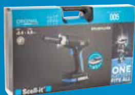
(1) Mallette de transport incluse