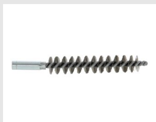
Eurocode 052976 Ecouvillon D.26