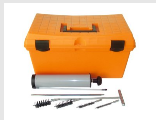
Eurocode 055832 Kit de nettoyage manuel