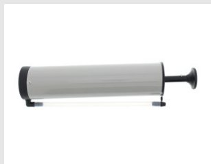
Eurocode 065990 Soufflette de nettoyage