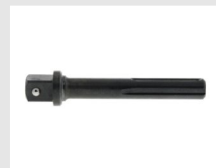
Eurocode 151500 Outil de pose tiges 20-24-30