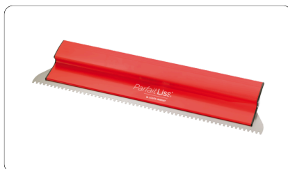
7541 - Couteau I.T.E ParfaitLiss'®