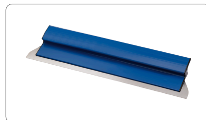
4541 - Lame dure ParfaitLiss'®