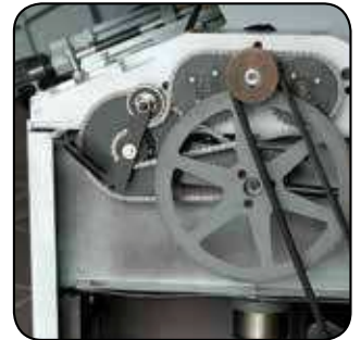
Entraînement des rouleaux par chaîne Entraînement moteur à double courroie Feeder drive chain. Dual belt drive motor