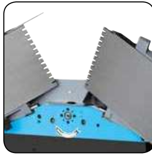
Ouverture papillon Throttle opening