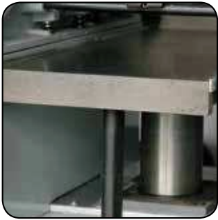
Table de rabotage montée sur 2 fûts Thicknesser table set on 2 supports