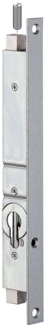
Plan page 137