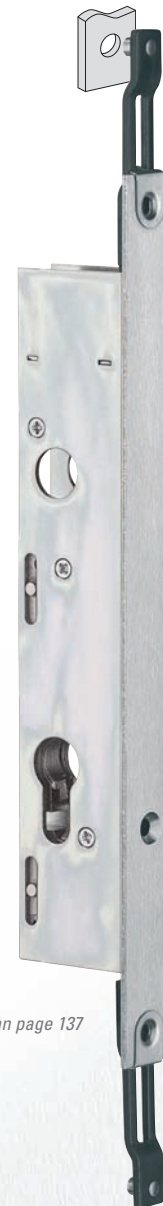
Plan page 137