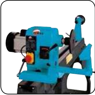
Rotation de la tête jusqu'à 180° Rotatie van de kop tot aan 180°