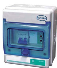
COFFRET CONTRÔLE REMPLISSAGE POUR CUVE A EAU