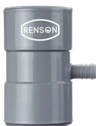
COLLECTEUR DE GOUTTIERE FILTRANT DN80/100