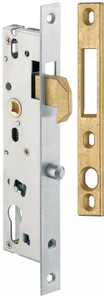
Plan page 144