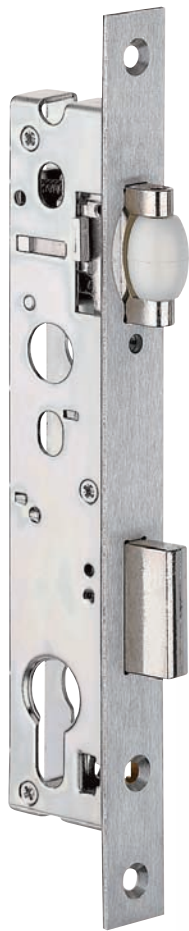
Plan page 138