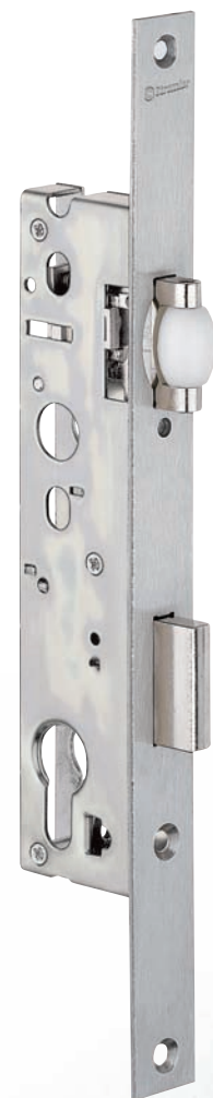
Plan page 138