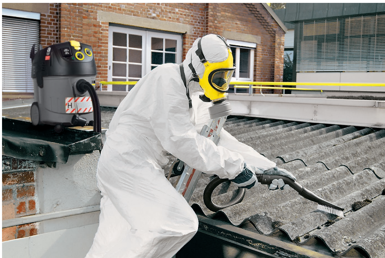
NT 35/1 Tact Te H