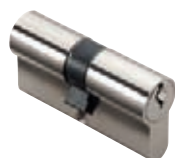
Cylindres panneton rayon 11,4 mm (PM2) p. 28