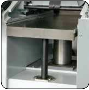
Table de rabotage montée sur 2 fûts Vandiktebanktafel geplaatst op 2 steunstukken