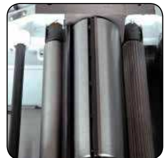
Rouleaux d'entraînement \varnothing 40 mm pour l'avance de la pièce de bois. Arbre de 95 mm à 4 fers Voedingsrollen met \varnothing 40 mm om het stuk hout voort te bewegen. As van 95 mm met 4 messen.