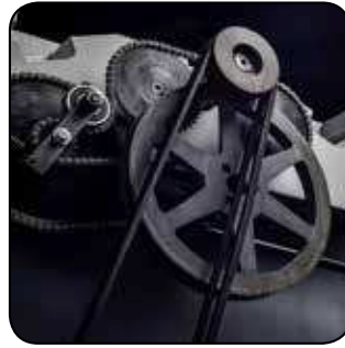
Entraînement des rouleaux par chaîne. Entraînement moteur à double courroie. Aandrijving van rollen via schakelketting. Aandrijving van motor met een dubbele riem